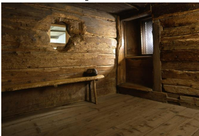
Einsiedelei und Zelle des Bruder Klaus im Ranft